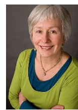
Marina Rex Viales für ein gesundes Leben

Die Teilnahme ist begrenzt. Wir freuen uns auf einen intensiven Austausch.